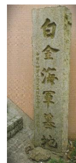
表一 現存する記念碑類

(主催) NPO 法人 旧真田山陸軍墓地とその保存を考える会 https://www.assmcc.org/